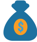
Finance & Housing