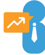
Urban Work Life