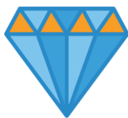
Quality of Urban Living