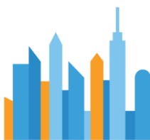
The Best and Worst Cities